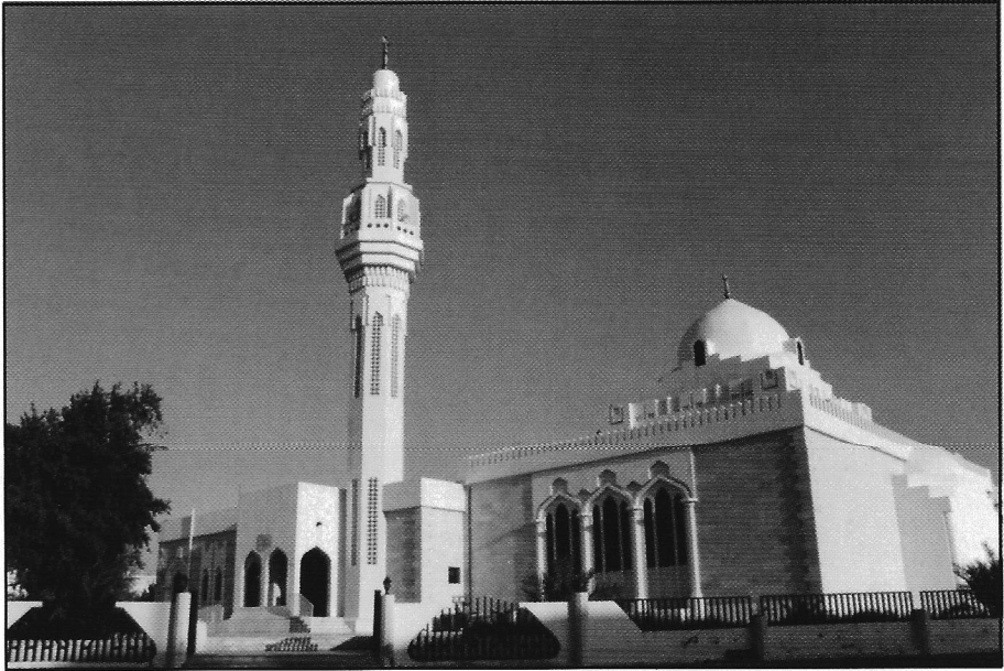
مسجد عيسى عبدالله عبدالعزيز العثمان في قرطبة