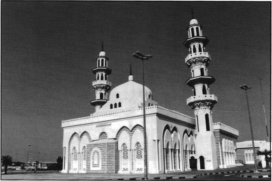
مسجد عيسى عبدالله عبدالعزيز العثمان في منطقة الخالدية

ويضم المسجد مكتبة وغرفاً للعاملين وجميع الخدمات الأخرى. ويبلغ ارتفاع المئذنة ٢٣ متراً، وقد بني المسجد على الطراز العادي الحديث ويشتمل على نقوش شرقية وأندلسية.