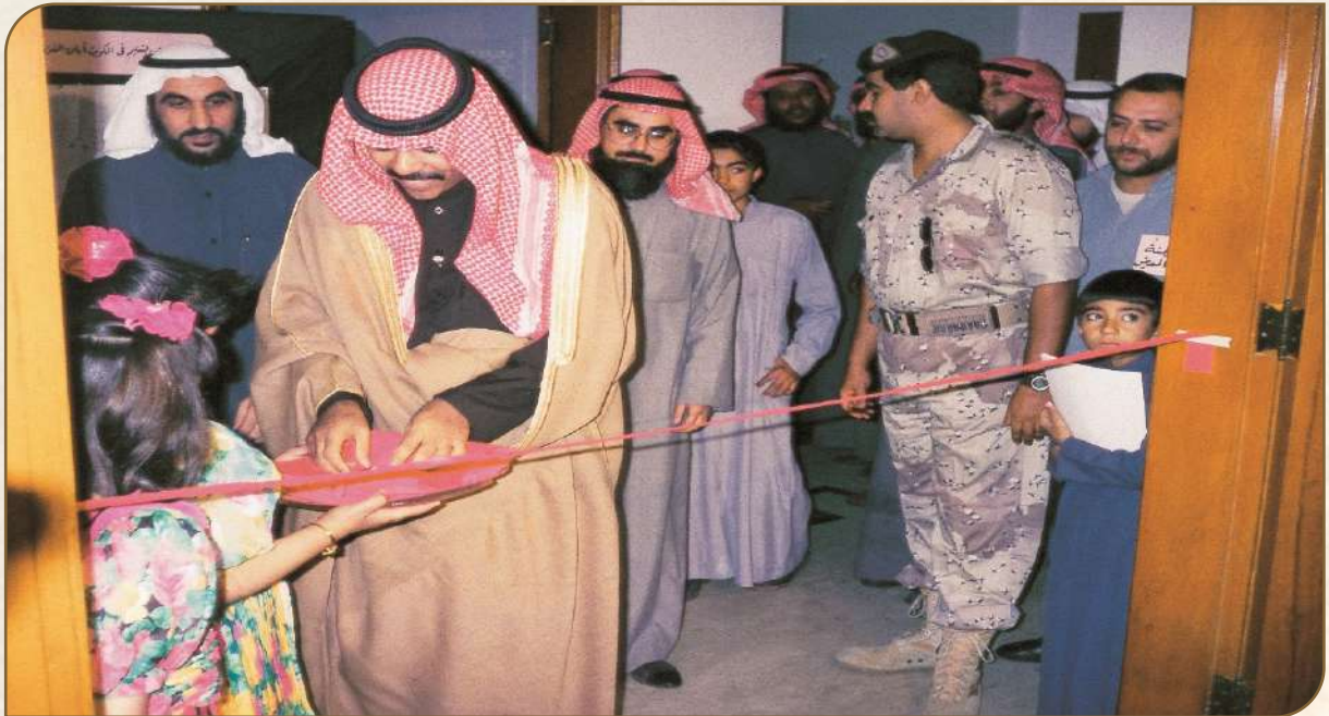
لحظة افتتاح معالي وزير الداخلية (آنذاك) الشيخ نواف الأحمد الجابر الصباح لمعرض التكافل لمخلفات الاحتلال العراقي وخلفه كل من إبراهيم محمد المهيني ود. عبدالمحسن الجارالله الخرافي