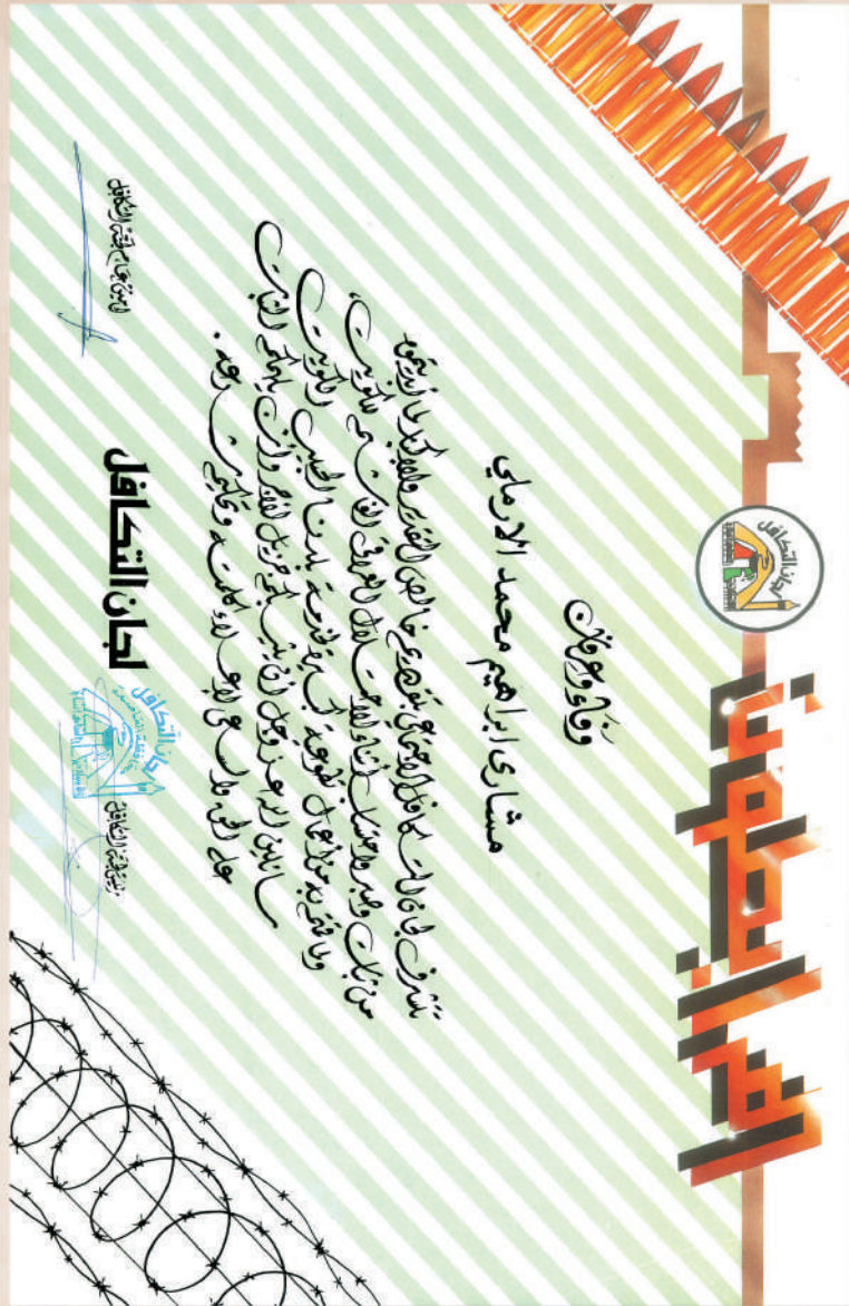
شهادة التكريم التي كانت تسلم للمتطوعين خلال الاحتفال

عَلَيْتَ مِرَابِطَ عَلِيٍّ مِرَابِطَ عَلِيٍّ مِرَابِطَ عَلِيٍّ مِرَابِطَ عَلِيٍّ مِرَابِطَ عَلِيٍّ