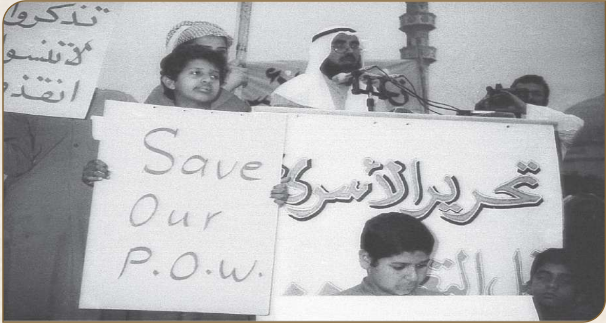
مشاركة رئيس صندوق التكافل لرعاية أسر الشهداء والأسرى بكلمة في المهرجان الخطابي المقام للمطالبة بعودة أسرانا وتحديد مصير شهدائنا المجهولين