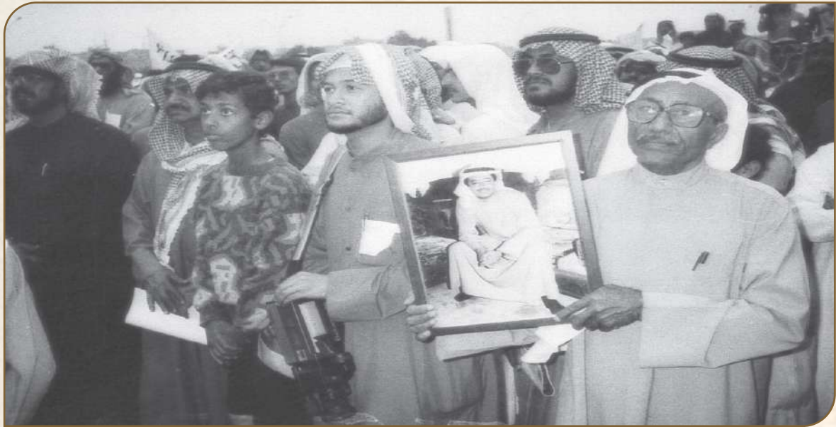
حضور المهرجان الخطابي من أسر الأسرى والمفقودين