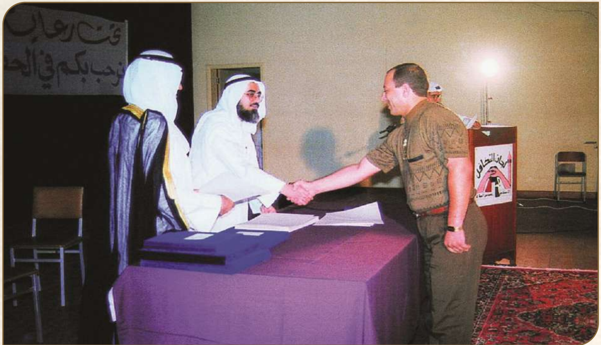
تكريم الأستاذ هيثم (سوري الجنسية) وقد أبلى بلاء حسناً في دعم المرابطين في الشامية، بل كان أحدهم وليس نسيب أحدهم فقط.