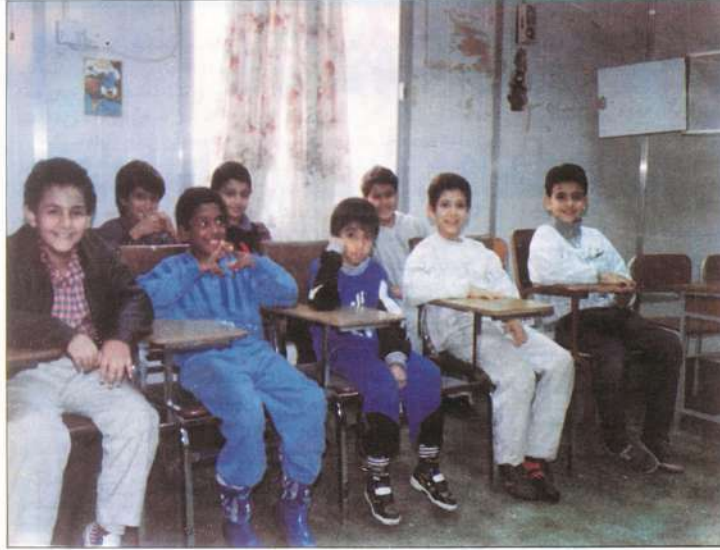
أحد فصول المرحلة الابتدائية

● هل كان الاهتمام بمرحلة الروضة يوازي اهتمامكم بالمرحلة الابتدائية؟