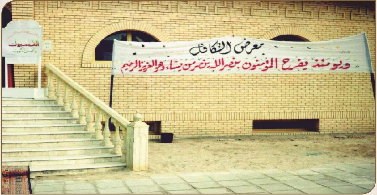
لافتة الإعلان عن معرض التكافل ولافتة الترحيب بالضيوف في ديوان السالم في الشامية قطعة ٩