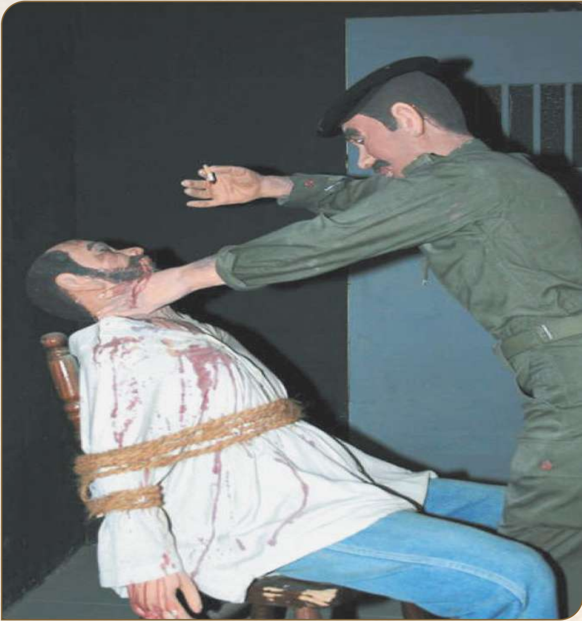
مجسم يصور بعض أساليب التعذيب