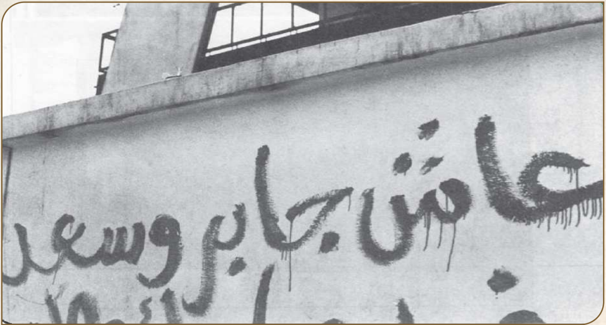
نماذج لحرب الشعارات التي وثقتها عدسات المرابطين