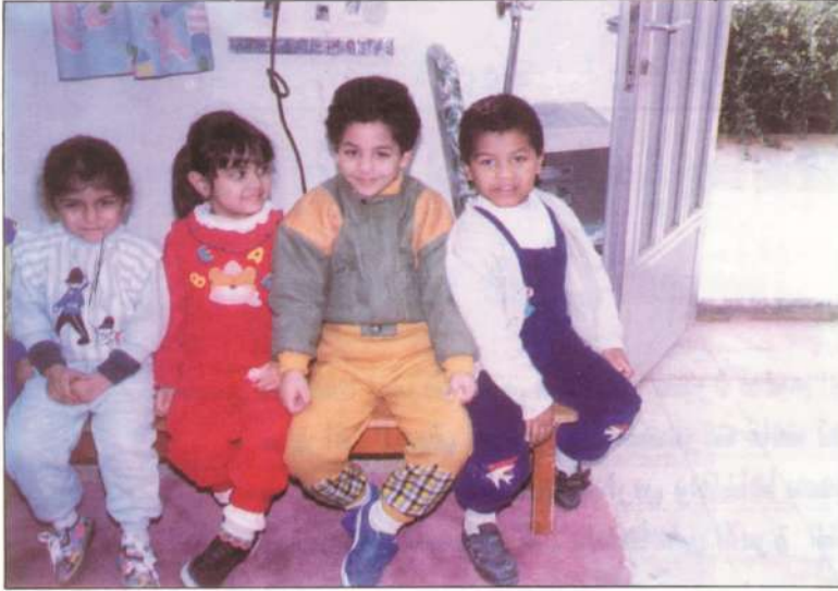
جانب من احد فصول رياض الاطفال

الجاليات العربية المتعاونة مع سلطات الاحتلال حيث كنا على يقين بأن لو اى منهم عرف عن مدرستنا فانه لن يسكت وسيضع سرنا خاصة وان الكويتيين رفضوا التعاون مع سلطات الاحتلال سواء في مشاركة العمل كمدرسين ومدرسات او كطالبة.