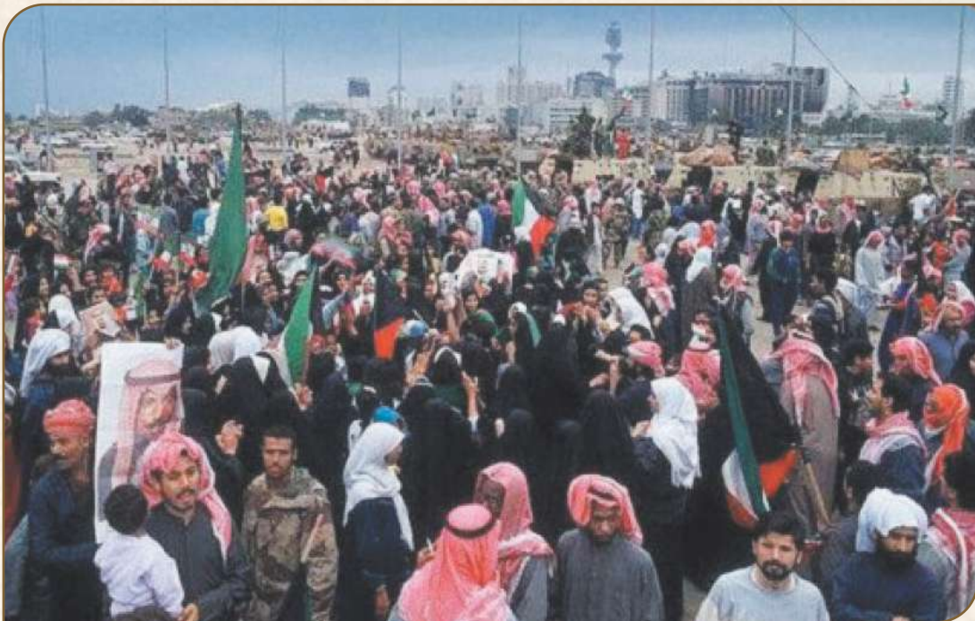
مشاهد من أفراح الكويت . . وتجمع الفرحة في ساحة العلم