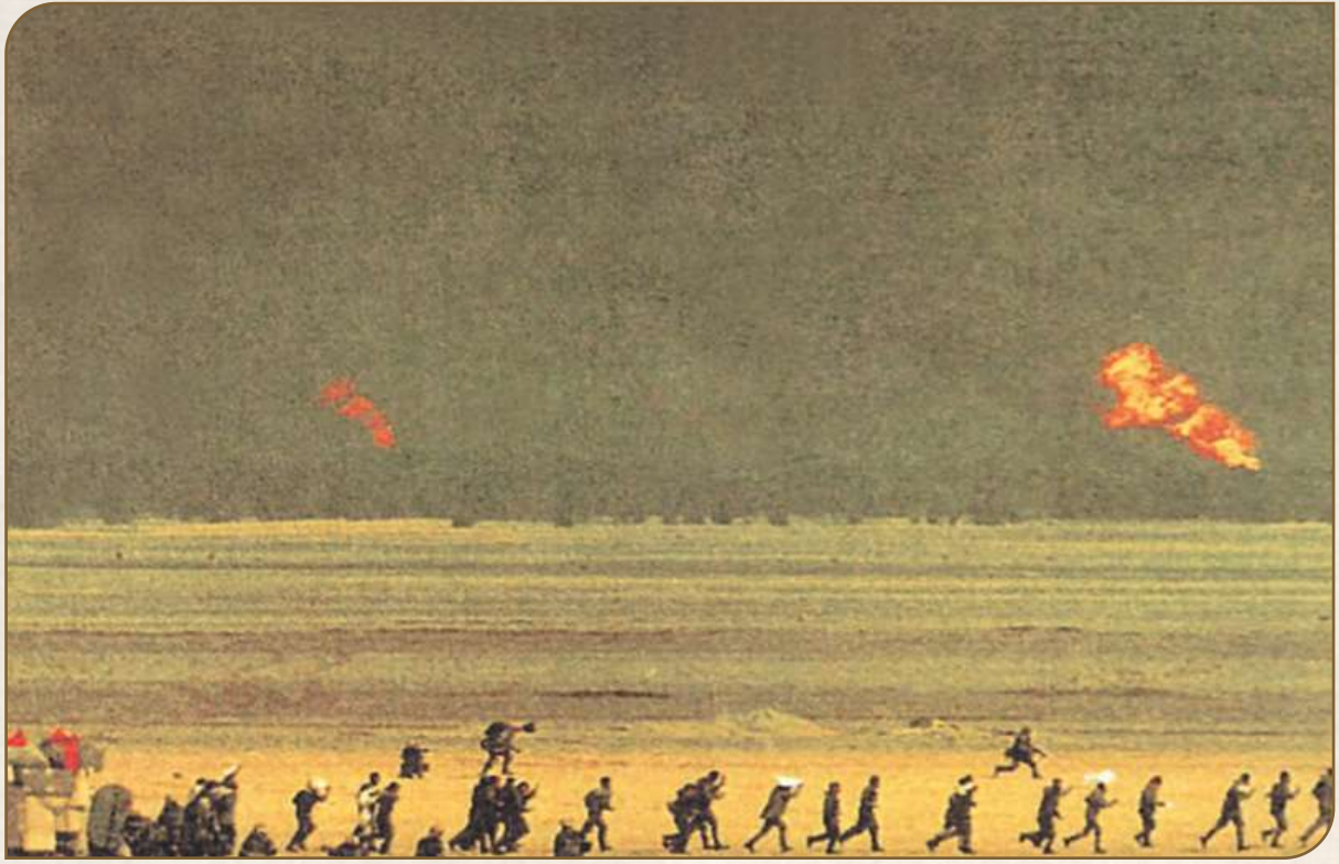
صورة الأسرى العراقيين أثناء الانسحاب، وتظهر خلفهم الحقول البترولية الكويتية التي فجرها الصداميون