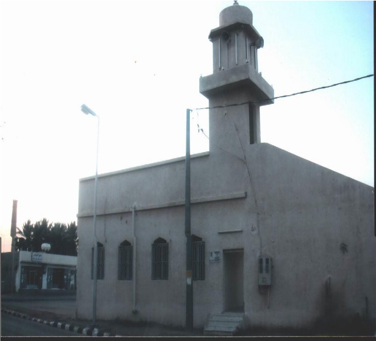
مسجد جلاجل في المملكة العربية السعودية